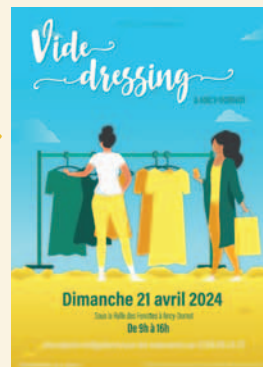
21 avril 2024 Vide dressing