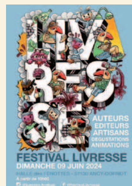
9 juin 2024 Festival Livresse