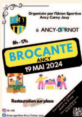
19 mai 2024 Brocante