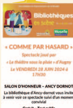
28 juin 2024 Bibliothèque en scène