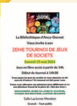
25 mai 2024 Tournoi de jeux