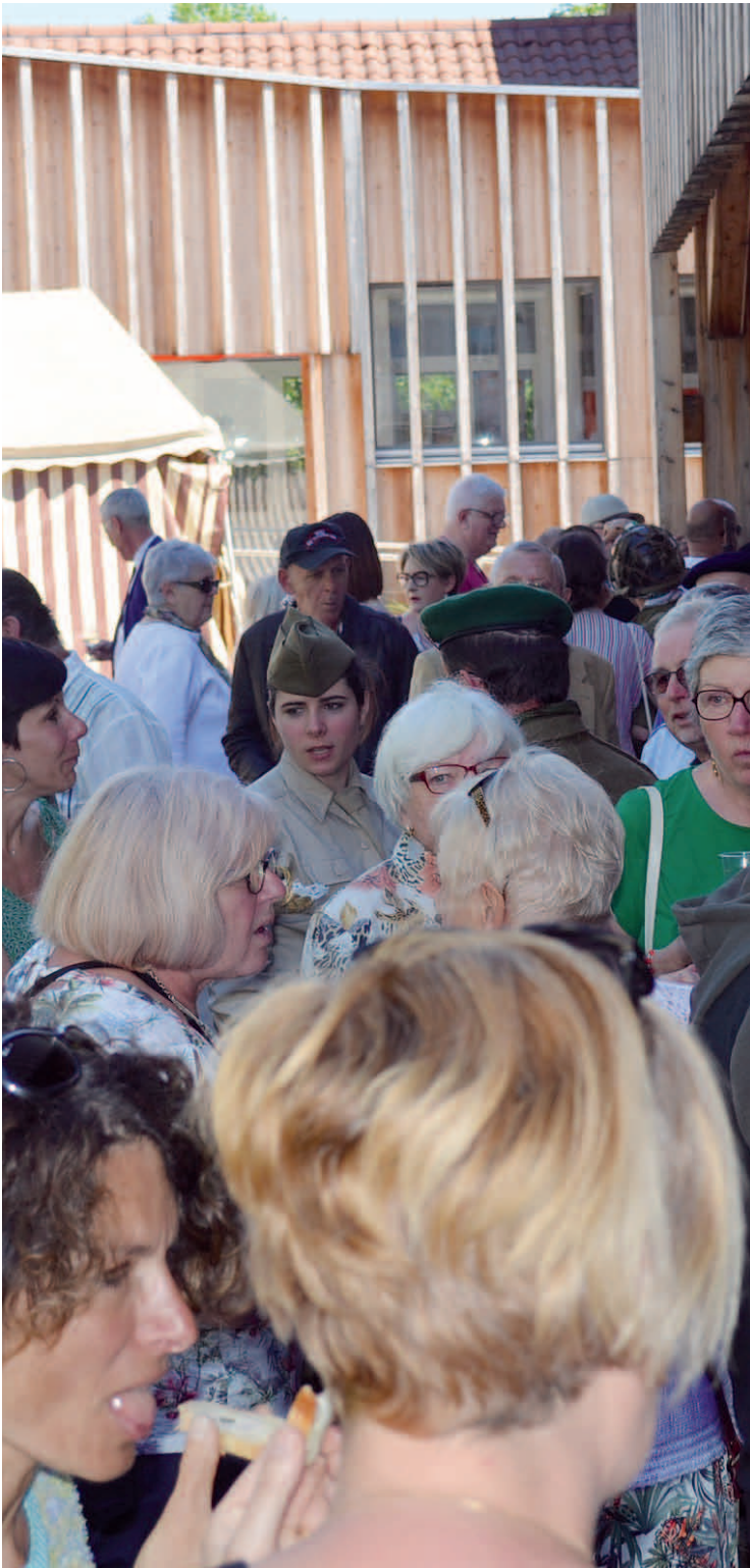
Manifestations 2025 p 12