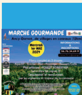
1er mai 2024 Marche gourmande