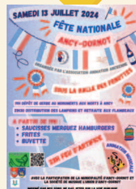
13 juillet 2024 Fête Nationale