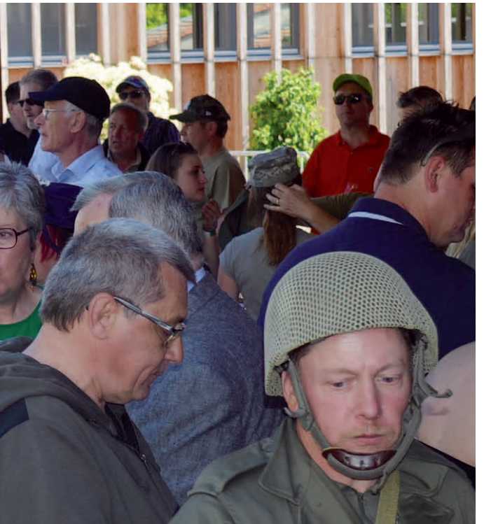
Association TORCOL p 4