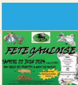
22 juin 2024 Fête Gauloise