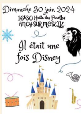
30 juin 2024 Concerts d'été