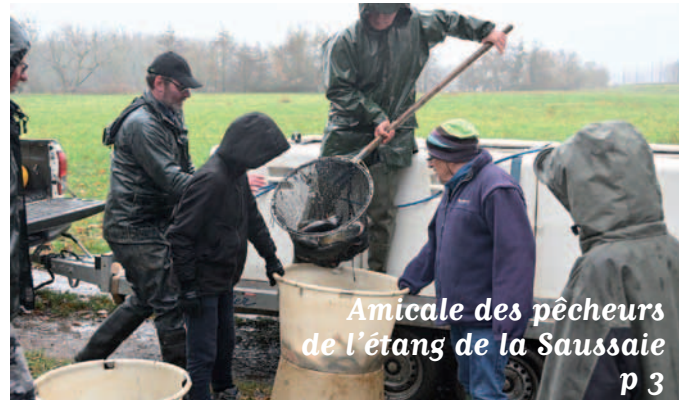
Amicale des pêcheurs de l'étang de la Saussaie p 3