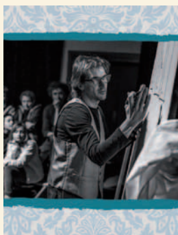
Spectacle / Marc en solo