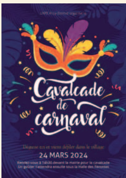
24 Mars 2024 Carnaval