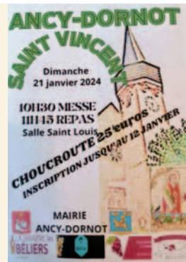
21 janvier 2024 Saint Vincent